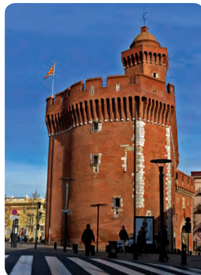
• Le Castillet à Perpignan