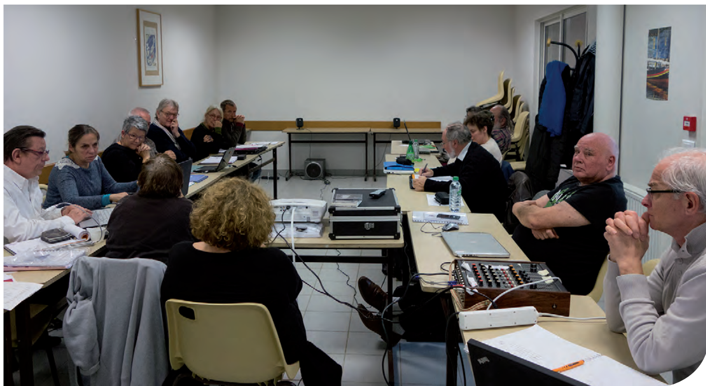
• Commission Audiovisuel - Les diaporamistes au travail

Courriel : audiovisuel@federation-photo.fr